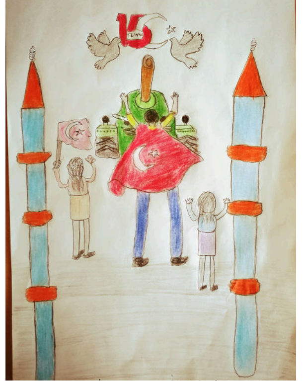
İREM SU SARIÇA 6/A